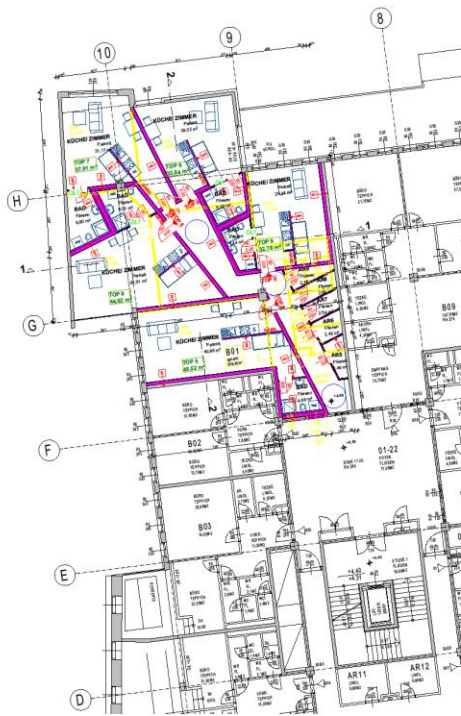
GRUNDRISS 1.OG, Planausschnitt, M 1:100