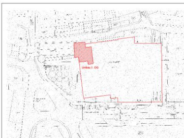
LAGEPLAN, M 1:750