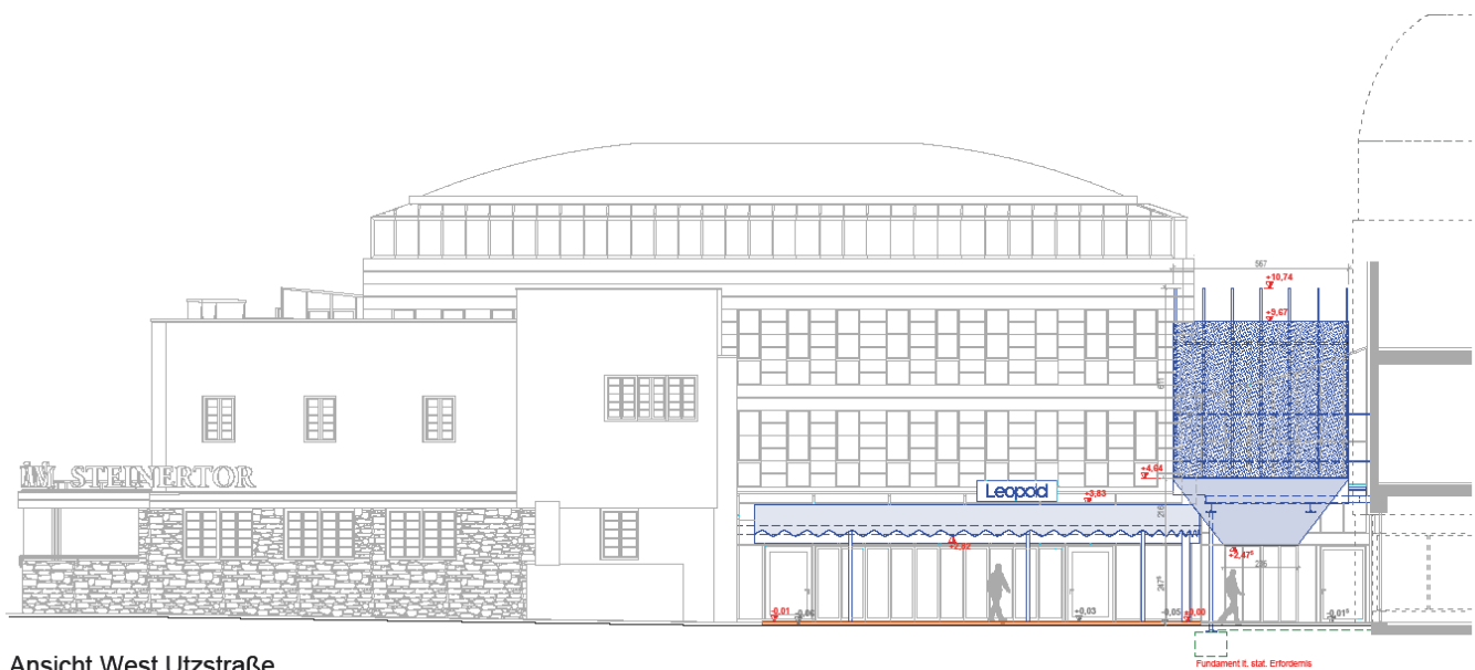
Ansicht West Utzstraße